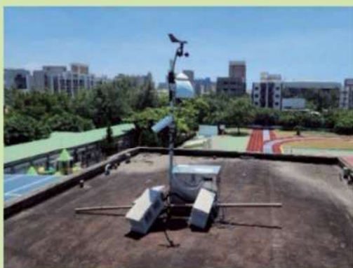
空氣感測器（包括風速、風向計）