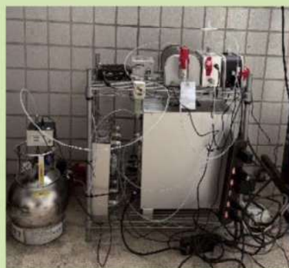
監測儀器及桶採樣